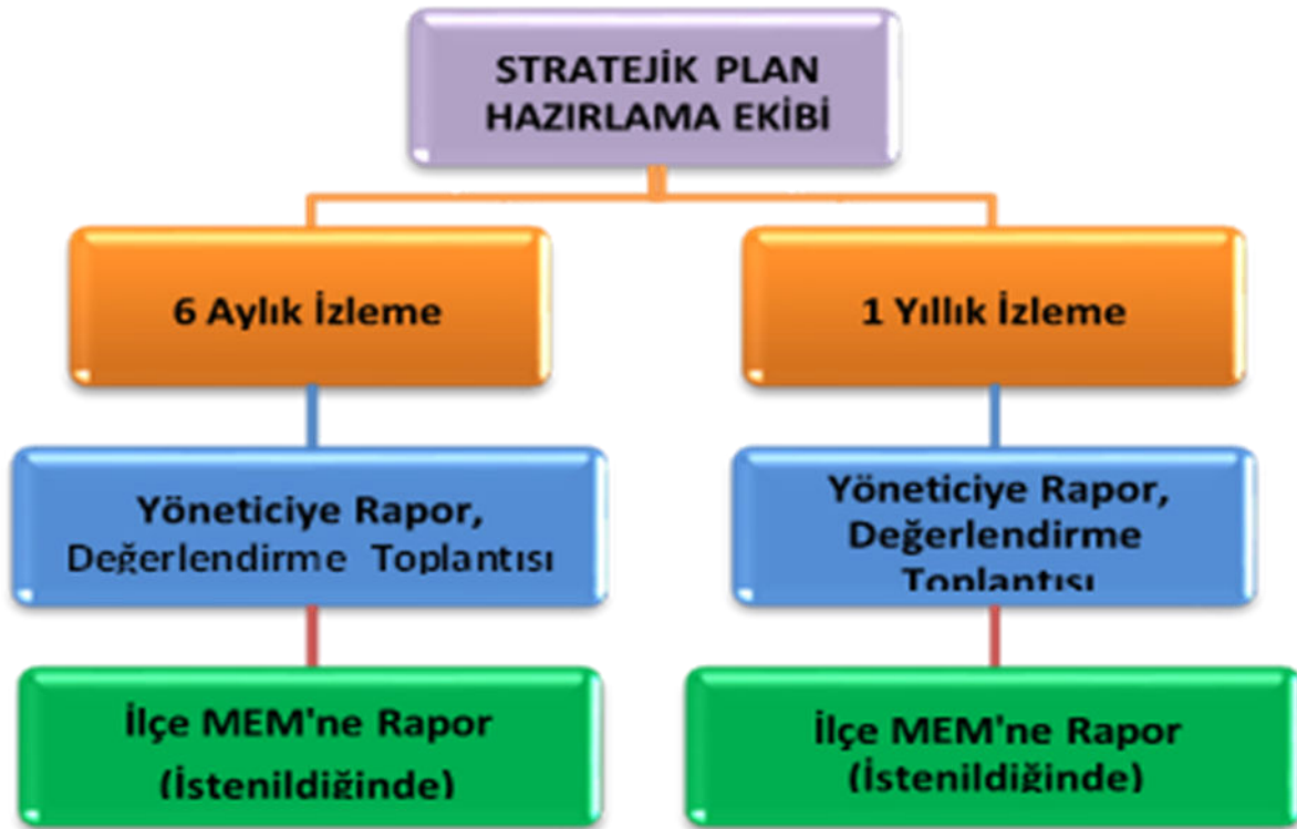
Şekil 3: İzleme ve Değerlendirme Süreci

Müdürlüğümüzün 2019-2023 Stratejik Planı İzleme ve Değerlendirme sürecini ifade eden İzleme ve Değerlendirme Modeli hazırlanmıştır. Müdürlüğümüzün Stratejik Plan İzleme- Değerlendirme çalışmaları eğitim-öğretim yılı çalışma takvimi de dikkate alınarak 6 aylık ve 1 yıllık sürelerde gerçekleştirilecektir. 6 aylık sürelerde rapor hazırlanacak ve değerlendirme toplantısı düzenlenecektir. İzleme-değerlendirme raporu, istenildiğinde İlçe Milli Eğitim Müdürlüğü'ne gönderilecektir. Ayrıca ilçemizin Mülki İdari Amirine sunulacaktır. 1 yıllık izleme-değerlendirme çalışmaları, Stratejik Planımızda yer alan hedeflerin yıllık düzeyde ifade edildiği Performans Programı ve yılsonunda gerçekleşme düzeylerinin belirlendiği Faaliyet Raporu hazırlanarak yapılacaktır.